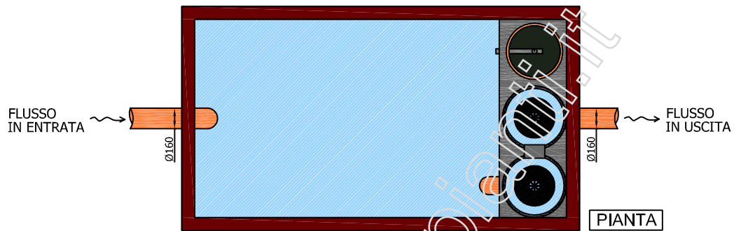
Disoleatore statico Mod. G2-Ds2